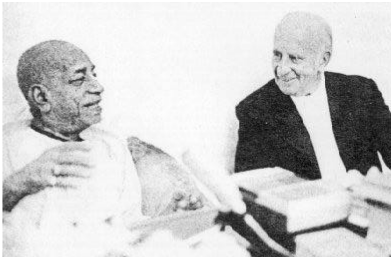
Śrīla Prabhupāda im Gespräch mit Graf Dürckheim

Gott zum Ziel. Wie ist das möglich?" Junge Menschen haben so viele Abwechslungsmöglichkeiten: Mädchen, Autos, Kinos, Restaurants, usw. Warum haben sie das alles aufgegeben? Wie ist das möglich, solange keine spirituelle Verwirklichung dahinter steht?