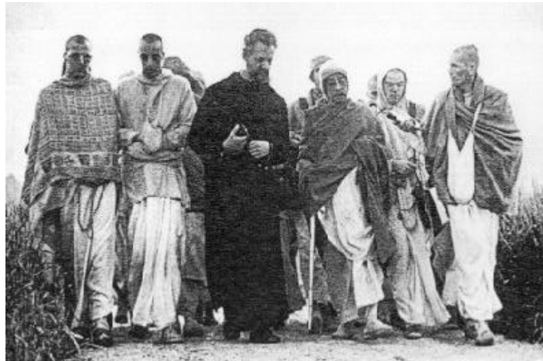
„'Du sollst nicht töten!' Es ist eine klare Anweisung! Warum sollen wir interpretieren?"